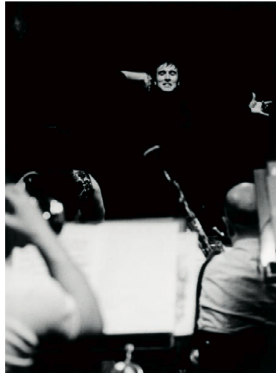
Claudio Abbado, 1965, da Memoria e passione. Da Capa a Ghirri. Capolavori dalla Collezione Bertero