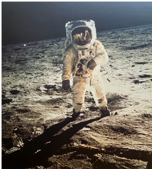
Archivio Publifoto Intesa Sanpaolo, Astronaute Buzz Aldrin sur sol lunaire , 20-21 juillet 1969 (NASA)