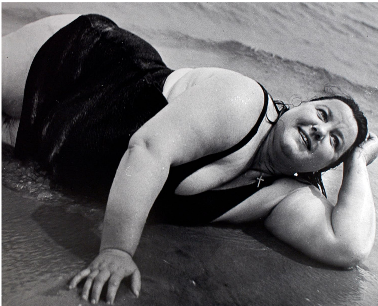
Lisette Model, Coney Island Bather , New York, c.1939

Attività educative per le scuole tra le opere esposte nell'ambito della mostra Camera Doppia. Horst P. Horst e Lisette Model e Archivio Publifoto Intesa Sanpaolo 1939-1981