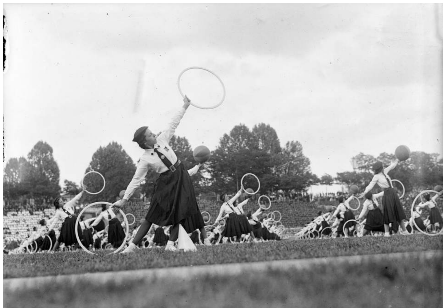
Saggio ginnico della Gioventù Italiana del Littorio (GIL) all'Arena di Milano, 1937-1943

Celebrità ritratte in posa o colte di sorpresa dall'obiettivo indiscreto dei paparazzi, atleti le cui gloriose imprese sportive vengono fissate sulla pellicola nei momenti salienti delle gare a cui partecipano: l'Archivio Publifoto Intesa Sanpaolo, memoria fotografica degli accadimenti del passato dell'Italia e del mondo, conserva al suo interno numerose immagini di personaggi , celebri e meno celebri, ripresi in pose diverse, spontanee o artefatte . La selezione di fotografie proposta sarà analizzata insieme agli studenti e utilizzata per dare avvio ad una riflessione condivisa sul tema dell'identità, propria e dell'altro , sulla sua rappresentazione, sul suo riconoscimento da parte del resto del "mondo" e sulla sua adesione a codici e linguaggi riconosciuti in una specifica epoca, a partire da un'analisi dell'oggi e dell'impatto che in tal senso hanno i social network . Il laboratorio sarà occasione per approfondire tali contenuti, attraverso la sperimentazione da parte degli studenti di pose ed espressioni caratteristiche , che potranno poi essere titolate , descritte sinteticamente e riallacciate al contesto di riferimento da cui provengono.