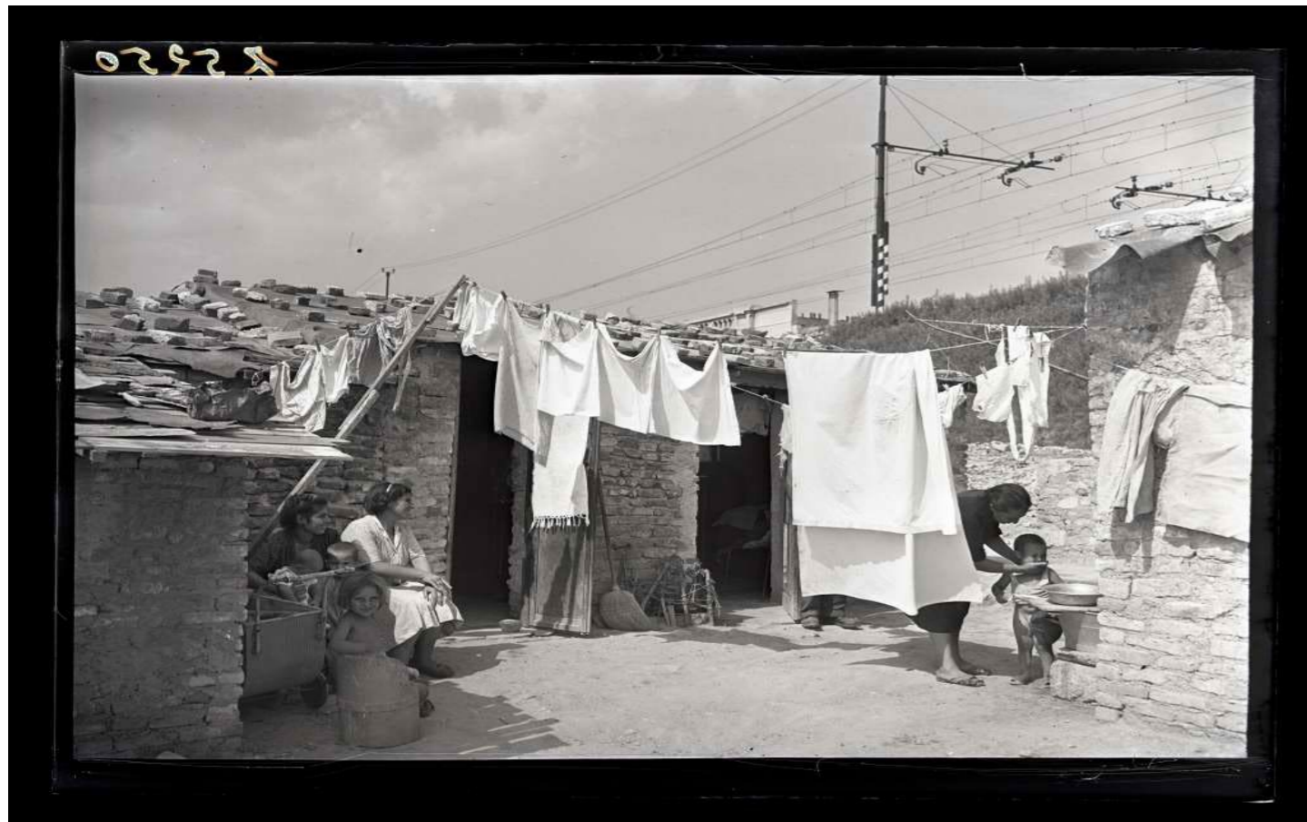
Donne e bambini alle Case Minime dell'Ortica, sono visibili i panni appesi ad asciugare tra le abitazioni, 12 luglio 1950

L'analisi di fotografie scattate in luoghi e momenti storici diversi sarà occasione per stimolare la capacità di osservazione: si indagheranno gli ambienti e i paesaggi ritratti alla ricerca di elementi utili alla lettura e alla comprensione dell'immagine. Introducendo un'attività ludica di narrazione collettiva, il laboratorio si aprirà ad una dimensione immaginifica, con la costruzione di storie attivando inedite relazioni tra fotografie realizzate in contesti diversi attraverso l'uso delle parole.