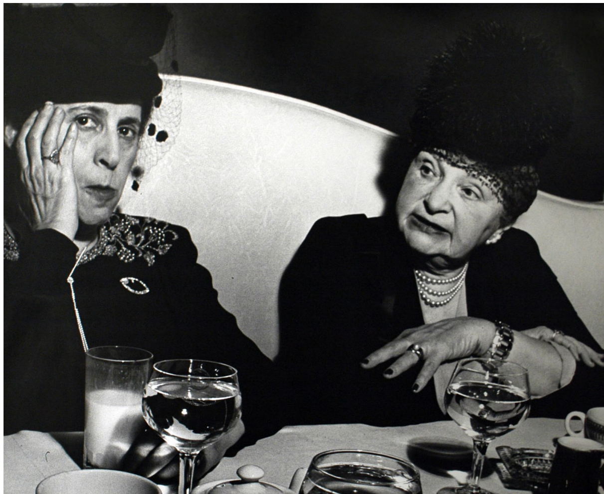
Lisette Model, Fashion Show, Hotel Pierre, New York, 1940-1946

Da un lato sorprendenti immagini di interni o di set fotografici caratterizzate da una cura estrema per il dettaglio, dall'altra scatti rubati, con approccio documentario, in contesti urbani che fanno da cornice a un'umanità varia, di cui spesso emerge il carattere grottesco. Osservando gli affascinanti ritratti ambientati di Horst e i capolavori della street photography di Model, i bambini inizieranno a scoprire come si legge un'immagine , come distinguere il vero dal falso e come, a volte, questi due piani si sovrappongano. L'attività di laboratorio sarà basata sull'associazione di una parola a ciascuna immagine , in modo da creare una catena di aggettivi che, letti l'uno dopo l'altro, descrivano gli ambienti rappresentati da Horst e quelli fotografati da Model, evidenziando differenze o forse facendo emergere elementi in comune.