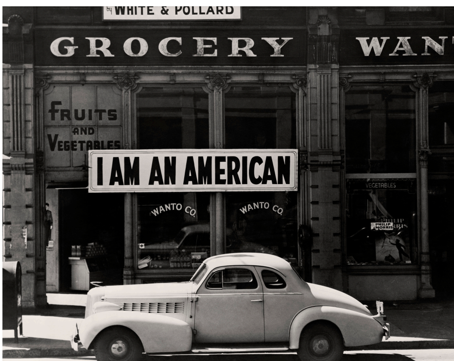
Dorothea Lange Un grande cartello con la scritta "Sono un americano" affisso sulla vetrina di un negozio il giorno dopo Pearl Harbor Oakland, California, 1942

La proposta educativa di CAMERA è progettata in collaborazione con Arteco .